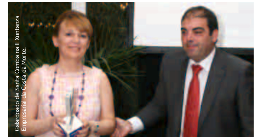
Galardoado de Santa Comba na II Xuntanza Empresarial da Costa da Morte.