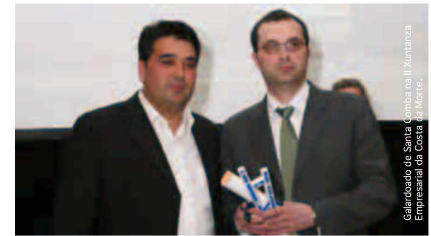
Galardoado de Santa Comba na II Xuntanza Empresarial da Costa da Morte.