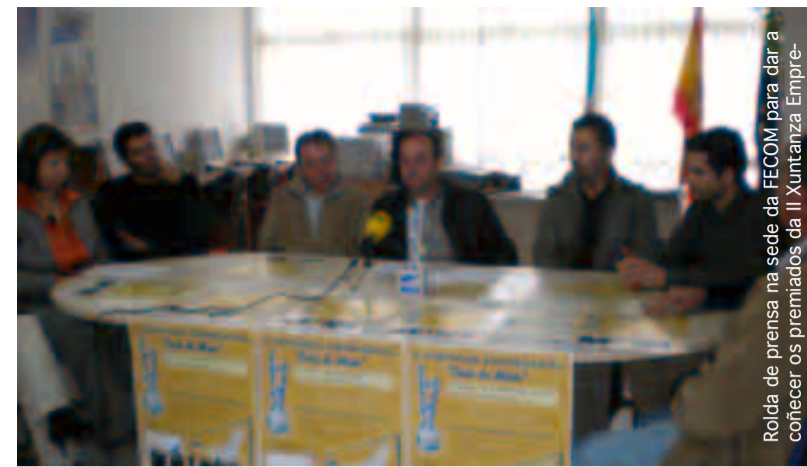
Rolda de prensa na sede da FECOM para dar a coñecer os premiados da II Xuntanza Empresarial da Costa da Morte.